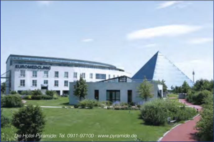
Die Hotel-Pyramide: Tel. 0911-97100 · www.pyramide.de